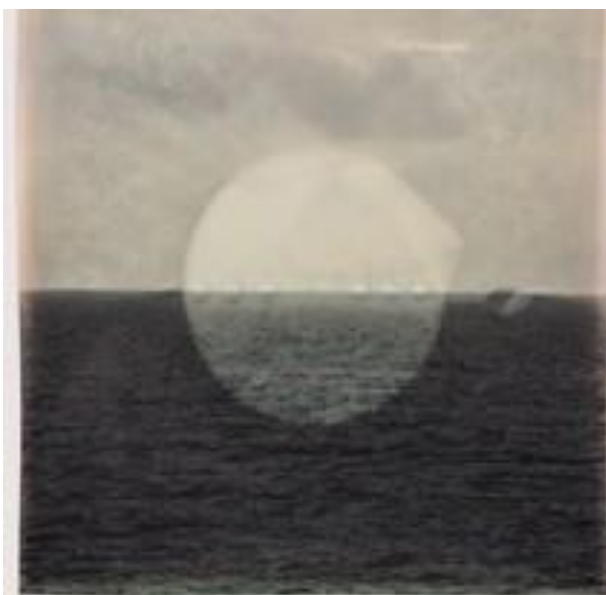
Juliette Andréa Elie, Sou O Silencio (S.O.S), Impression pigmentaire sur papier parchemin, miroir carré, relief à la pointe sèche, 50 x 50 cm

Certains des photographes représentés dans l'exposition proposent une vision complètement décalée du paysage, voire spectaculaire et parfois même surréaliste, comme les déserts de Michel Szulc-Krzyzanowski ou la Chine d'Yves Gellie.