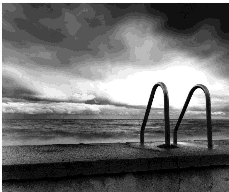
Mimmo Jodice, Lipari : Piscina, 1999, Tirage argentique, n°2/6, 100 x 120 cm

Les saisons d'Antoine Poupel, de Nathalie Grenier ou de Karen Farkas font jaillir la nature par éclats et touches de couleurs vives telle la vie qui nous rappelle sa force et ses droits. Cette exposition est une ode aux artistes qui offrent une multitude de regards et de perceptions poussant le spectateur à rêver, réfléchir, imaginer et se laisser surprendre par une poésie sans cesse réinventée.