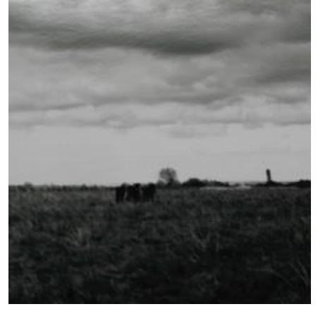
Chrystèle Lerisse, Camarguaise 3, 2013, Tirage argentique, n°2/5, 7 x 7 cm

Franco Fontana quant à lui, vient perturber nos repères en renversant les perspectives et superposant les plans successifs, bouleversant les cadrages et nous conduisant à une autre vision d'un champ de colza ou d'un nuage dans le ciel.