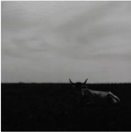
Chrystèle Lerisse, Maraichine 6, 2012 Tirage argentique, n°2/5, 7 x 7 cm