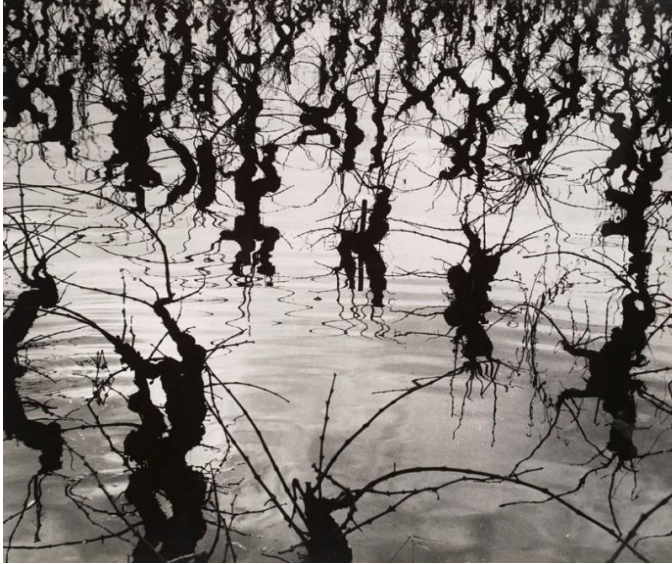
Lucien Clergue, Le marais d'Arles, 1960, Tirage argentique, n°9/20, 50 x 60 cm