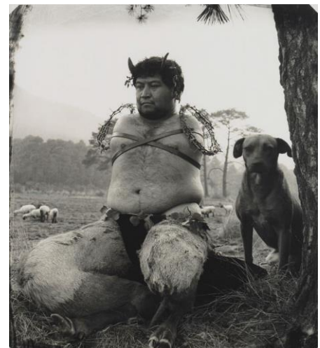
Joel-Peter Witkin, Satiro, 1992 Tirage argentique, 38 x 33 cm